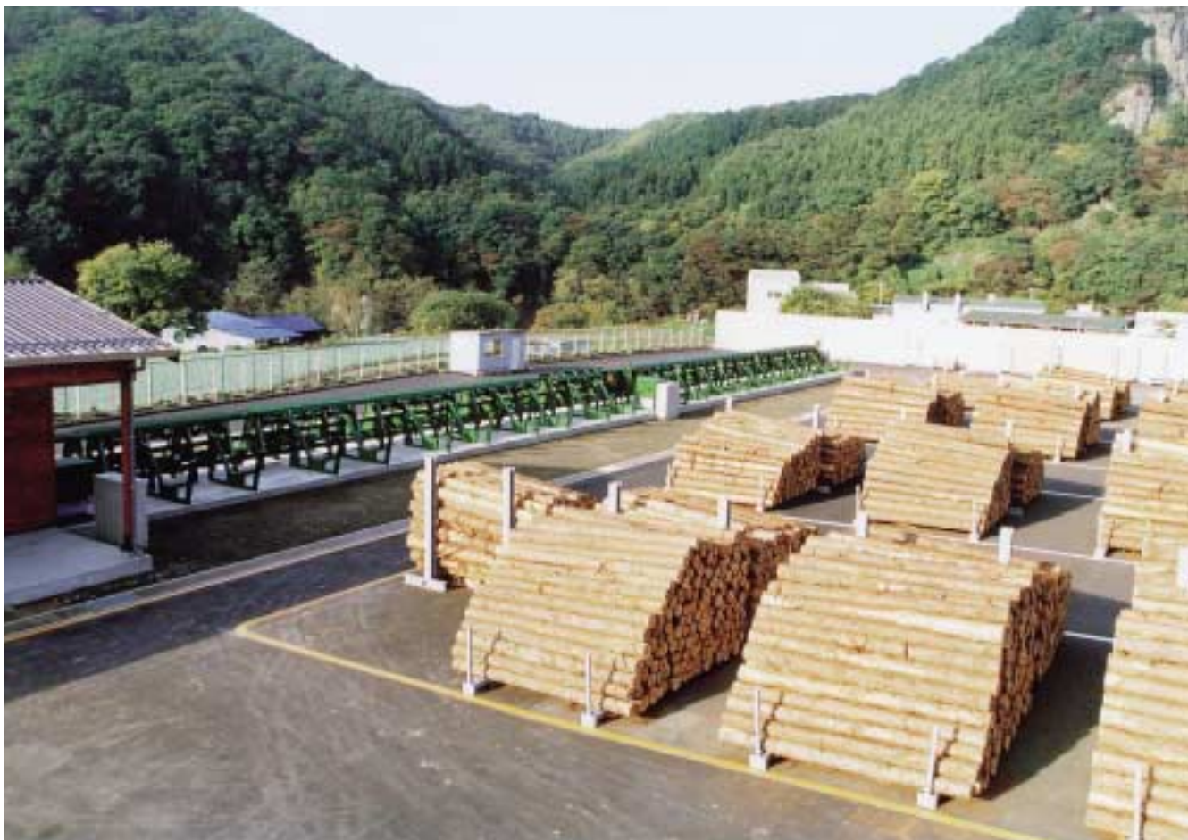
原木自動選別機ライン