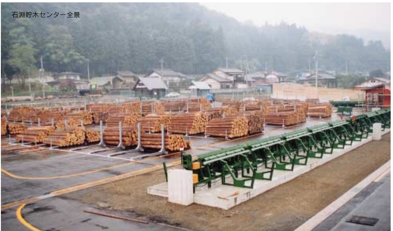
石淵貯木センター全景

私たちの意識と体制の変化が皆様のお役に立つように率直なご意見をお聞かせください。今回は創刊準備号として「石淵貯木センター」の竣工を速報いたします。