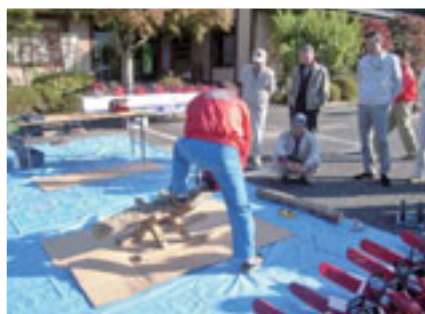
▲チェーンソーの点検