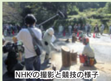
NHKの撮影と競技の様子