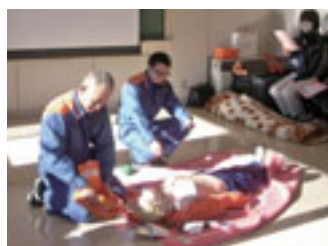
AED取り扱い方を受講