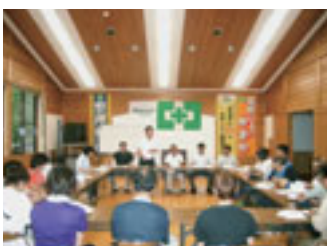
安全衛生委員会組合長挨拶