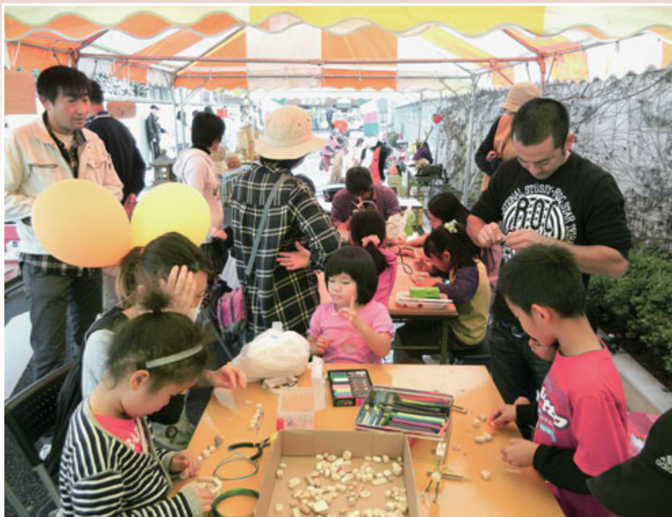
富岡市産業祭にて