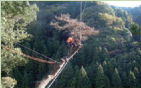
伐採木は県道へ落とすことはできないため、スイングロープにより尾根に引き上げる