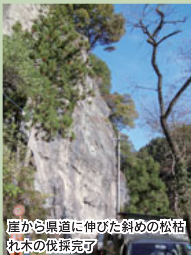
崖から県道に伸びた斜めの松枯れ木の伐採完了