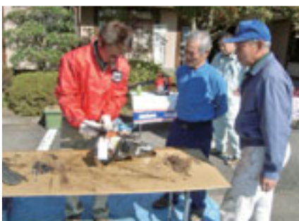
▲新ダイワ及び三山工業技術者による機械点検