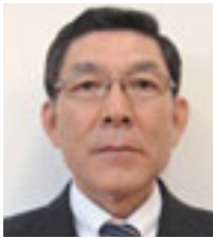
理事 黨 實