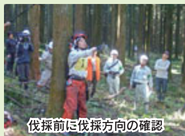
伐採前に伐採方向の確認