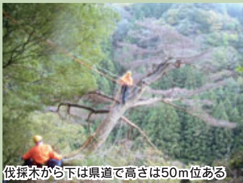
伐採木から下は県道で高さは50m位ある