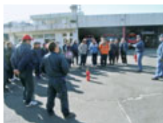
消火器の取り扱い方を下仁田消防職員の方々より講義