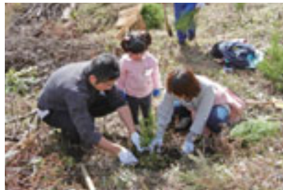
親子で成長を願いながらていねいに植樹