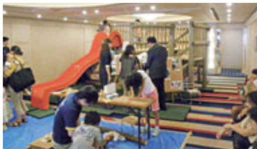
▲園関係者に木製遊具説明