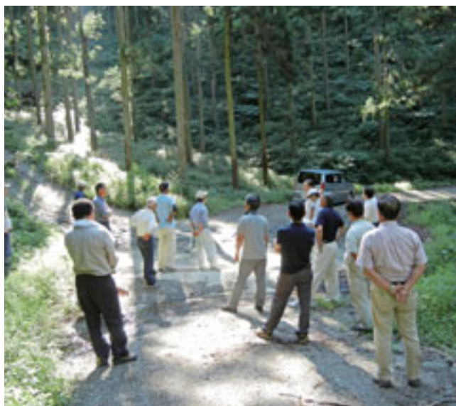
現地研修丸岳団地(団地面積75ha作業道延長2,650m)

第1号議案 平成23年度上半期業務及び仮決算承認について 第2号議案 コンプライアンスについて 第3号議案 その他 作業道関係の町補助金嵩上げ陳情について