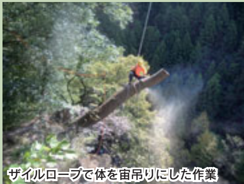
ザイルロープで体を宙吊りにした作業